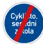
Konec jiného příkazu

Můžeme se setkat také se značkou s nějakým nápisem. Ten určuje, co máme udělat. V tomto případě sesednout a vést kolo.