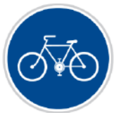
Stezka pro cyklisty

Touto značkou je označen úsek cesty vyhrazený pouze cyklistům.